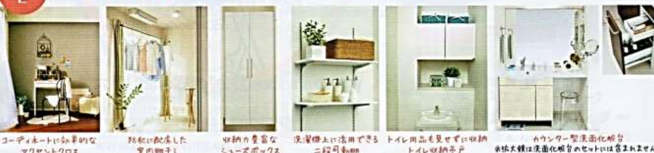
コーポレートに馴染むな マクセントクロス 防犯に配慮した 室内物干し 収納力豊富な シューズボックス 洗濯機上に活用できる 二段可動棚 トイレ用品も見せずに収納 トイレ収納扉 カウンター型洗面化粧台 ※床大鏡は洗面化粧台のセットには含まれません。